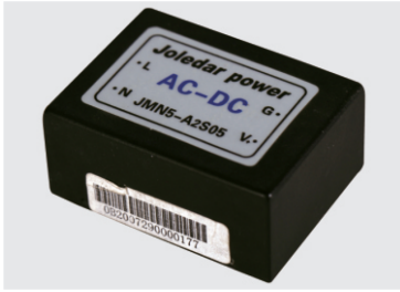
49 × 36 × 22mm